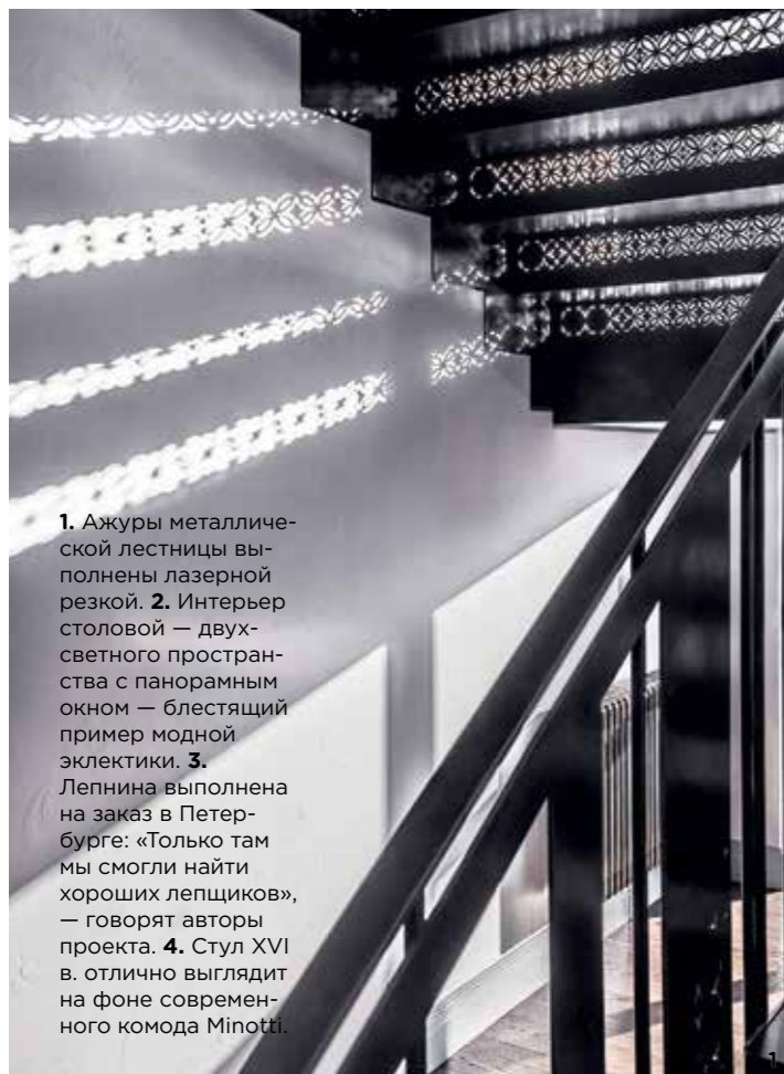
1. Ажурные металлической лестницы выполнены лазерной резкой. 2. Интерьер столовой — двухсветного пространства с панорамным окном — блестящий пример модной эклектики. 3. Лепнина выполнена на заказ в Петербурге: «Только там мы смогли найти хороших лепщиков», — говорят авторы проекта. 4. Стул XVI в. отлично выглядит на фоне современного комода Minotti.