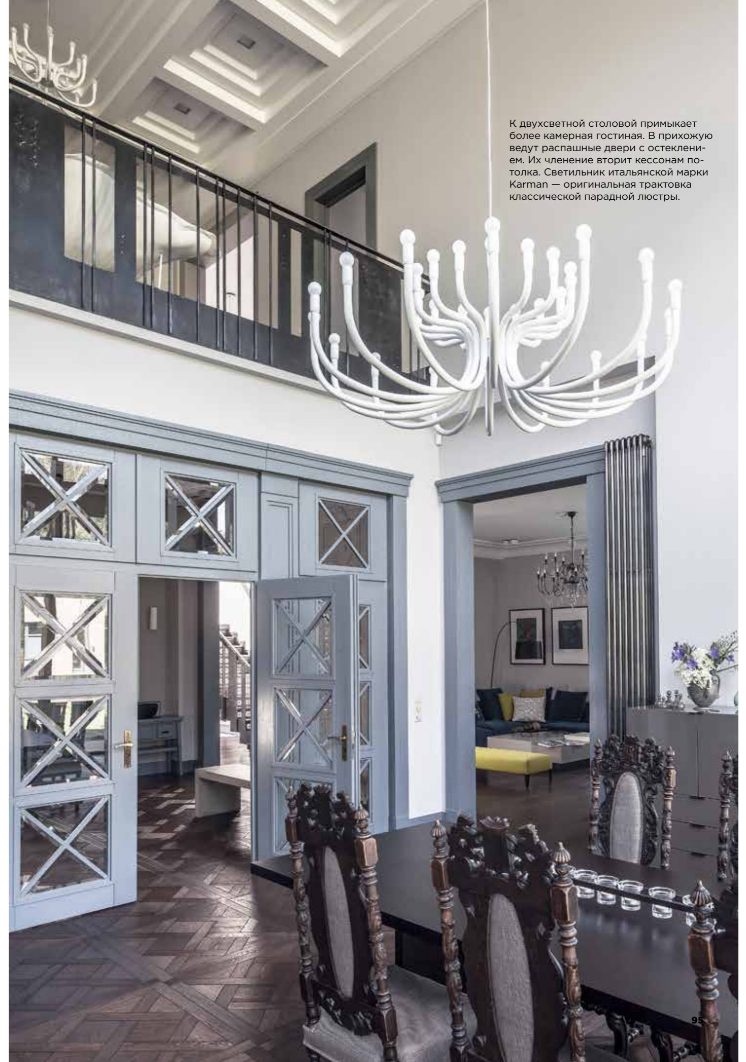
К двухсветной столовой примыкает более камерная гостиная. В прихожую ведут распашные двери с остеклением. Их членение вторит кессонам потолка. Святильник итальянской марки Kartan — оригинальная трактовка классической парадной люстры.

«В этом интерьере очень важны детали, поэтому почти все в нем сделано на заказ по нашим эскизам, от дверей и лепнины до бронзовых крючков. Помимо внешнего вида изделий, мы вникали в нюансы и технологию производства, чтобы все получилось не только красивым, но и качественным и долговечным. Очень важно продумать эти мелочи, ведь интерьер должен быть хорош не только в момент сдачи и фотосессии, но оставаться красивым и через годы. Уборка, замена лампочек, ремонт сантехники — это неизбежная жизнь объекта, о которой не всегда думают, создавая идеальную визуализацию на экране. След от тряпки на крашеной стене может через неделю разрушить идиллию».